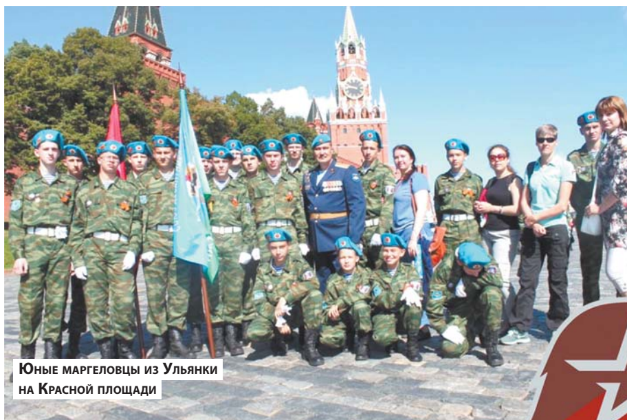
ЮНЫЕ МАРГЕЛОВЦЫ ИЗ УЛЬЯНКИ НА КРАСНОЙ ПЛОЩАДИ