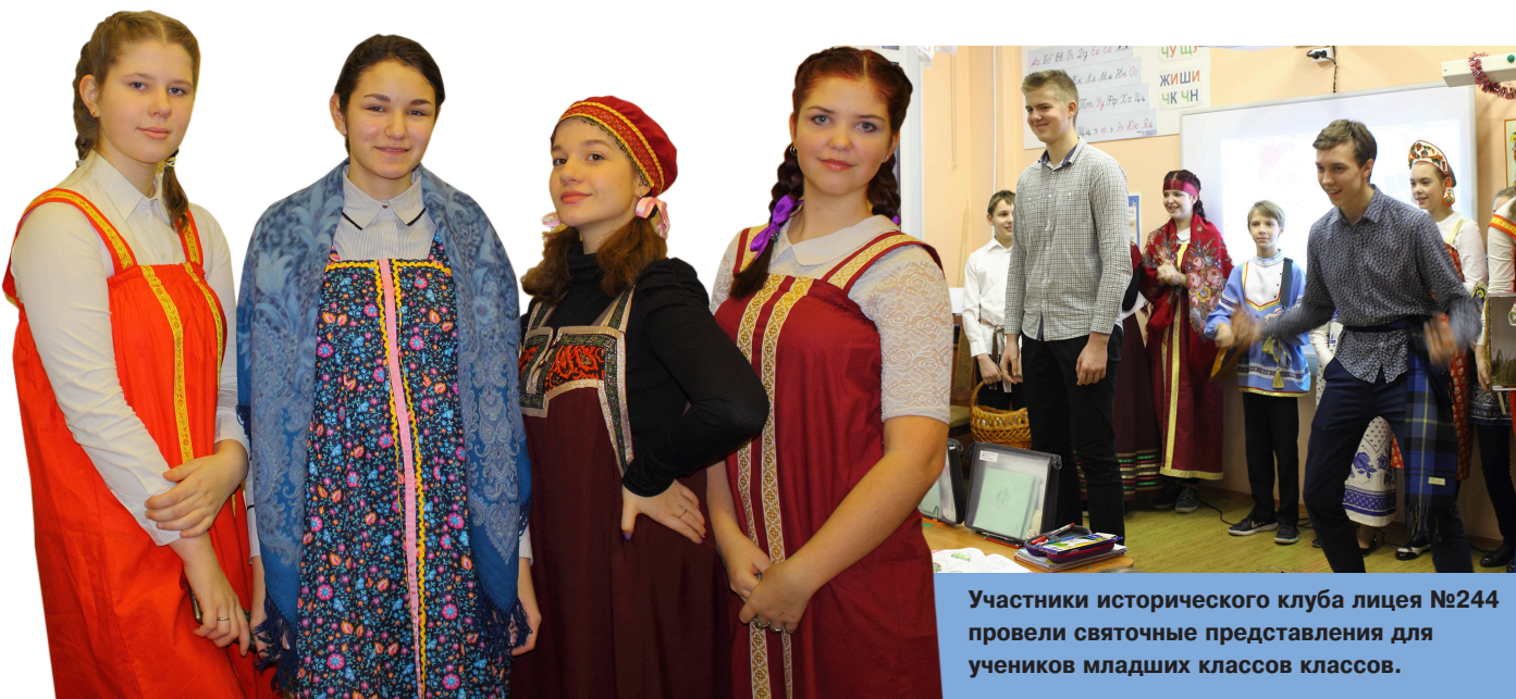
Участники исторического клуба лицея №244 провели святочные представления для учеников младших классов.