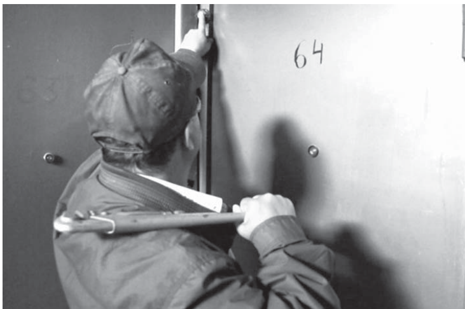
Не впускайте посторонних в дом

Обмен денег без официального объявления, а тем более на дому проводиться не может! Никогда!