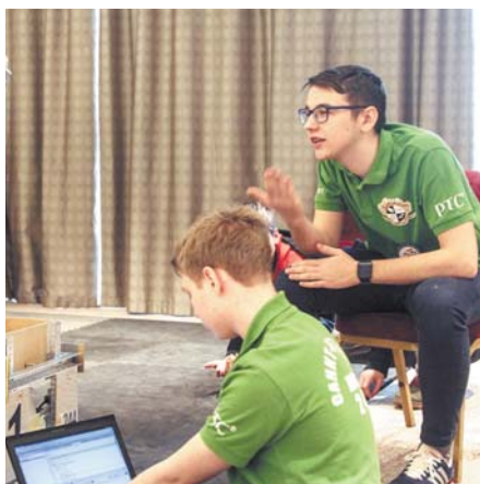
Главное – единство в выработке стратегии