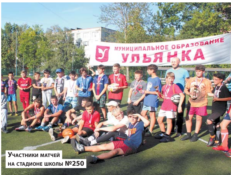
Участники матчей на стадионе школы №250